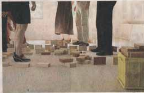
Mit Klötzchen werden bei der Systemtherapie familiäre und andere Konstellationen nachgestellt.